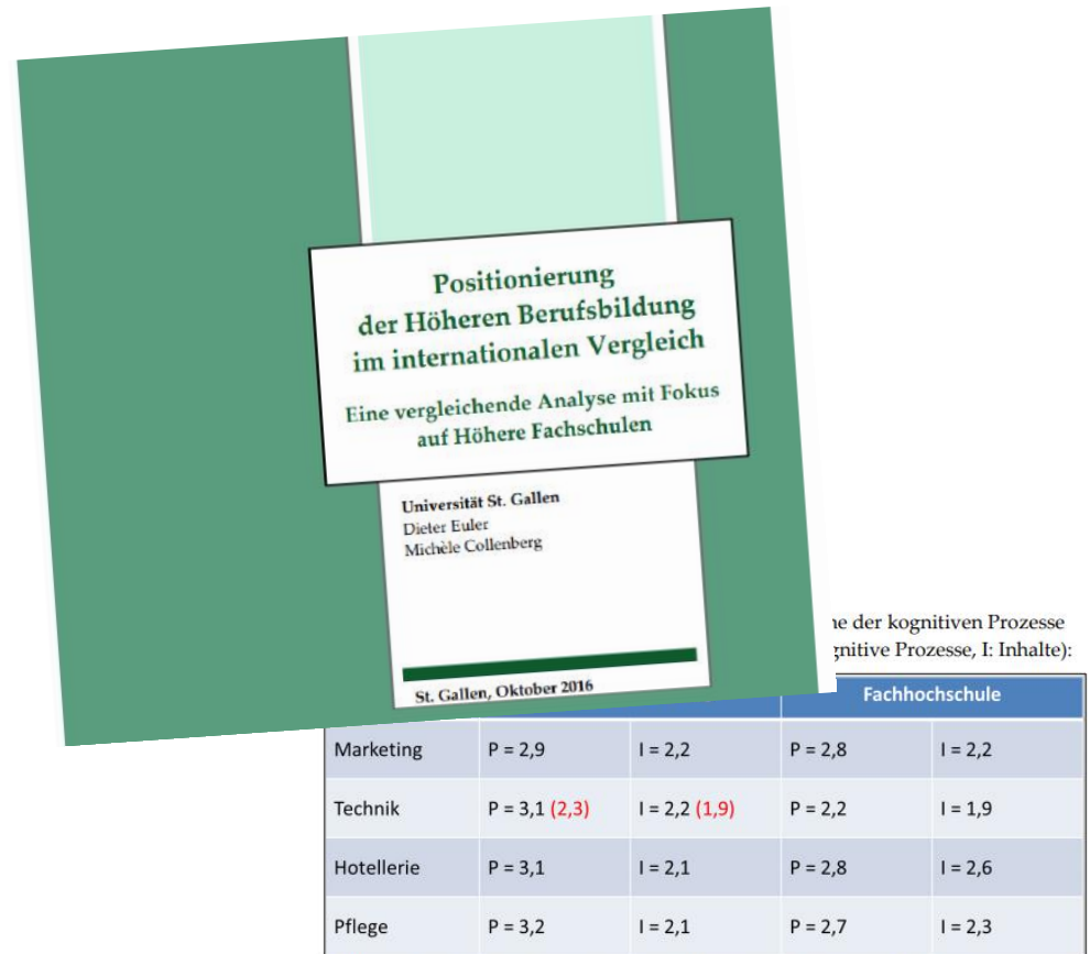
Abbildung: Vergleich der Kompetenzniveaus Höhere Fachschule – Fachhochschule

Zusammenfassung Schlussbericht 31. Juli 2020